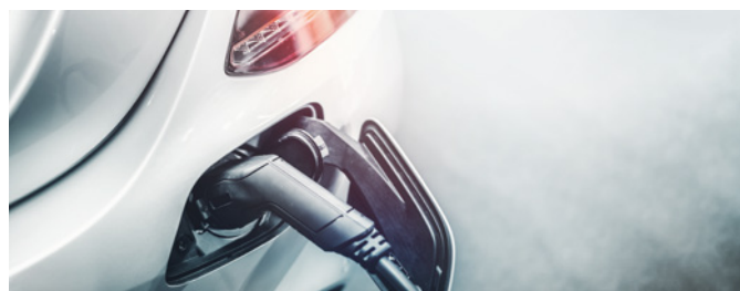
Elektrofahrzeuge als Dienstwagen: Neue Regelungen